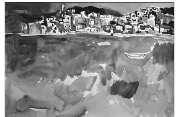
Oskar Koller, Am Meer, 1965