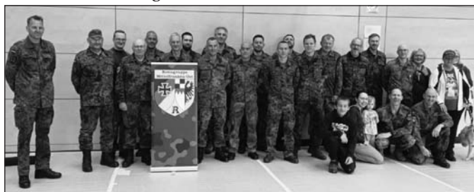
Neben der Reservistenkameradschaft Großschaidt war auch wieder die Wandergruppe der Heroldsberger Kärwamadla und Kärwaboum vertreten.

Für unsere 50. Veranstaltung hatten sich dieses Jahr mehr als 30 Vereine angemeldet. Zum Schluss konnten wir rund 700 Teilnehmer begrüßen.