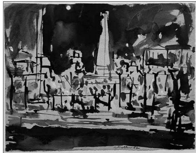
Oskar Koller, Place de la Concorde, Paris, 1952

Die Ausstellung wird mit Leihgaben der Oskar-Koller-Stiftung und des Kunstmuseums Erlangen unterstützt.